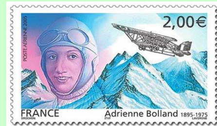
Timbre de France paru en 2005

- 1921 – le 1 er avril , la française Adrienne Bolland (1895-1975), traverse la Cordillère des Andes à bord d'un Caudron GIII. Elle est le premier pilote à réussir cet exploit, sur une ligne qui fera quelques années plus tard les grands jours de l'Aéropostale de Mermoz, Guillaumet et Saint-Exupéry. Avec son appareil, pour franchir les montagnes, elle doit atteindre l'altitude de 14.000 pieds (4.200 m.) et affronter une température glaciale – la suite de cette aventure racontée par Adrienne Bolland elle-même: http://www.aerodrome-gruyere.ch/hommage/cordillere.htm