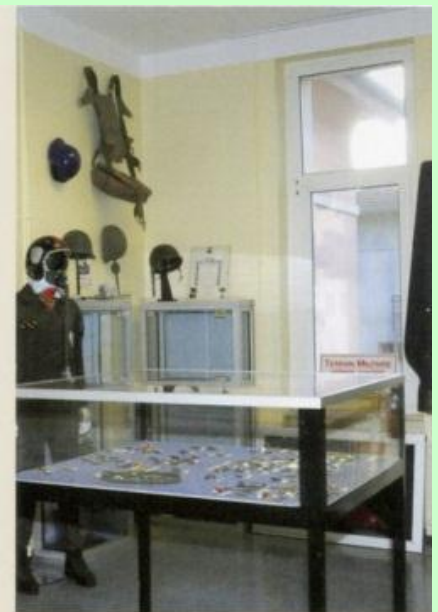
Fliegerkombi und Helm aus der Zeit Anfang der 1980er-Jahre